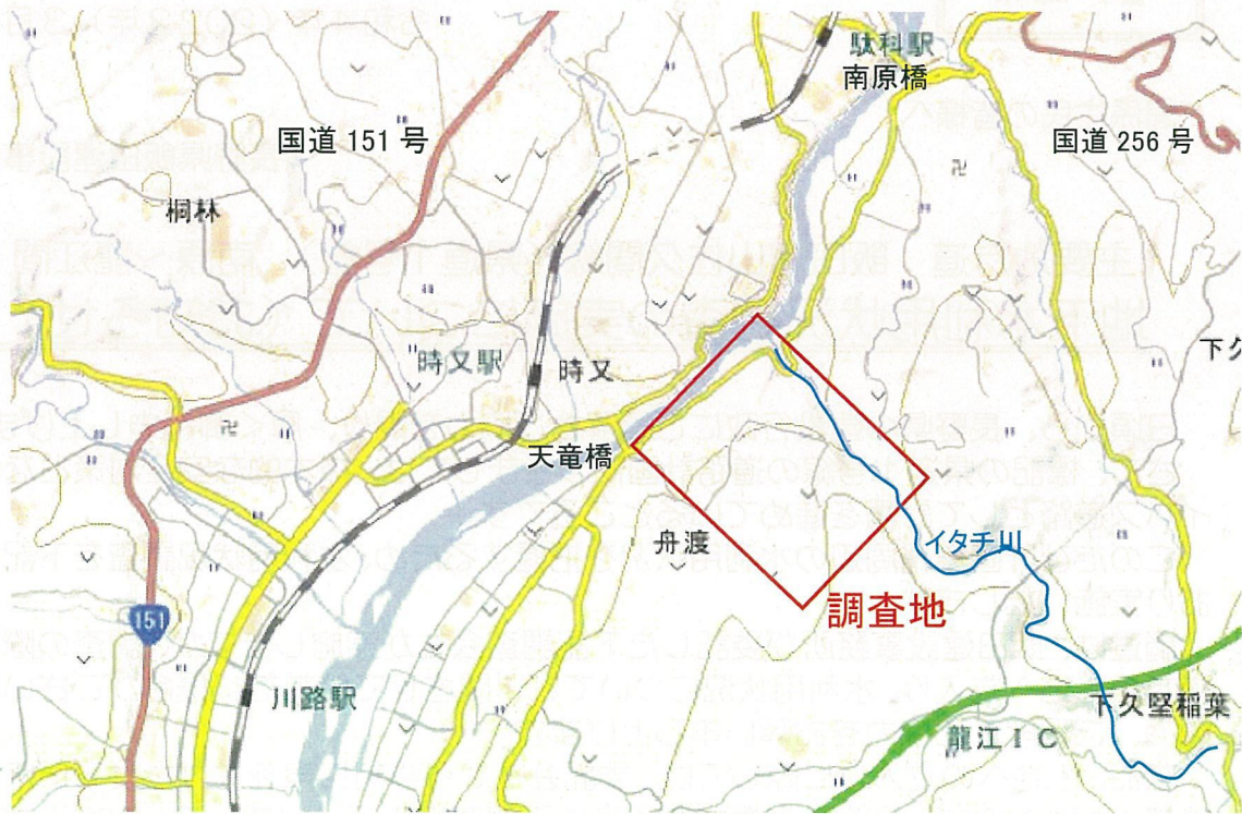
図1 調査位置図(広域)