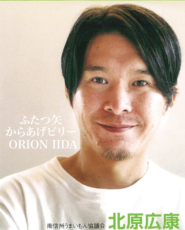
ふたつ矢 からあげビリー ORION IIDA