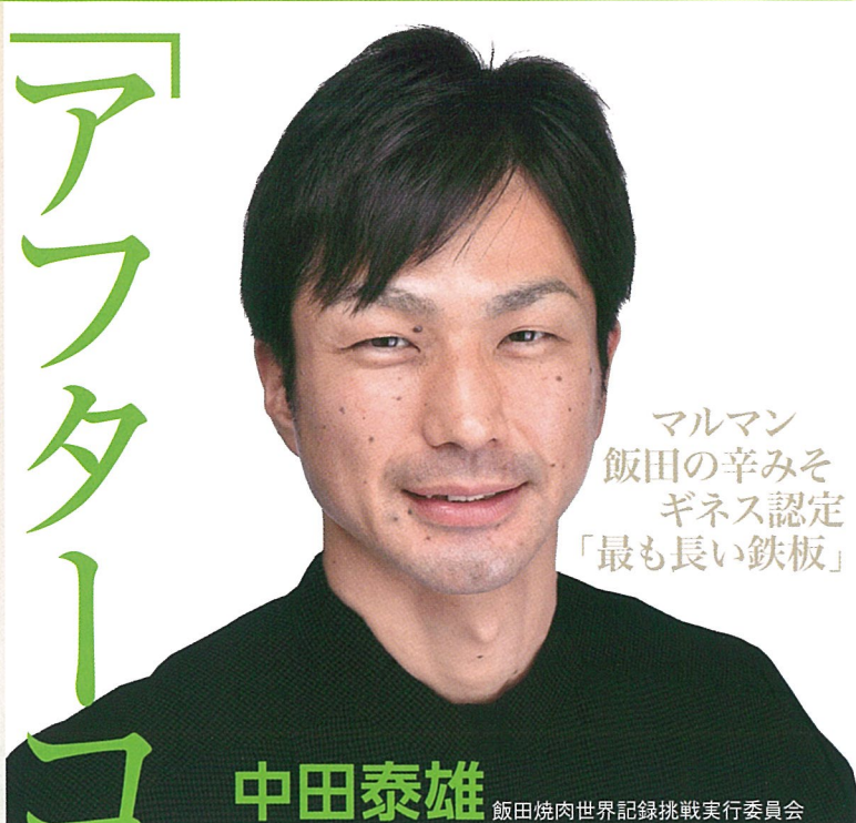
マルマン 飯田の辛みそ ギネス認定 「最も長い鉄板」

飯田市生まれ。株式会社岳代表取締役社長。南信州うまいもん協議会主宰。大学卒業後、東京四谷にある出版社で営業、広報、企画を経験。起業を目的に30歳のタイミングで飯田市へ移住。ラーメン店「ふたつ矢」を開業後、「唐揚げ好き」が高じて、からあげ専門店「からあげビリー」や地域密着型BAL「美味しい酒場」「殿岡ダイナー」をオープン。現在は飯田市に3店舗、岐阜県東濃地方に5店舗の飲食店を展開。企業スローガンに「おもしろい会社をつくりましょう。」掲げる。