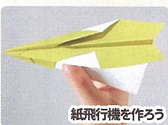
紙飛行機を作ろう