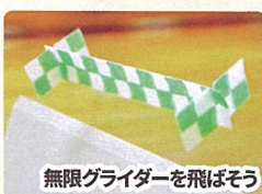
無限グライダーを飛ばそう