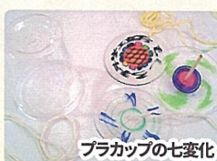
フラカップの七変化