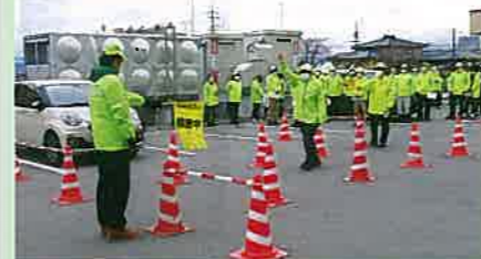
春の交通安全運動に向け、新役員を対象に受傷事故防止等のための研修会を実施した。(中高)

交通安全協会は、交通事故をなくすため、様々な活動を行っています。活動の一例を紹介します。