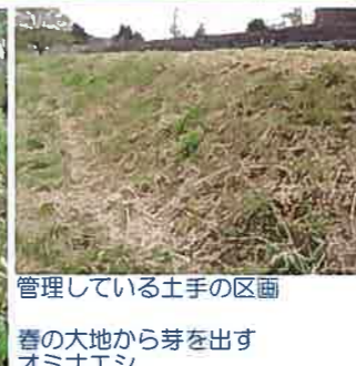
管理している土手の区画