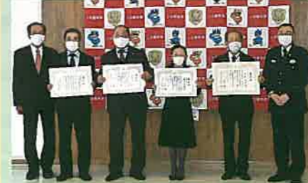
交通安全賞章緑十字章、銀章受賞者及び交通安全優良事業所に対して表彰伝達を行った。(上田、依田窪)