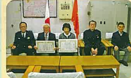
交通安全賞章緑十字章受賞者に対して警察署長から伝達が行われた。(長野南)