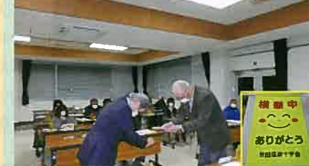
春の全国交通安全運動に向けて依田窪緑十字会から依田窪安協へ横断旗が寄贈された。(依田窪)