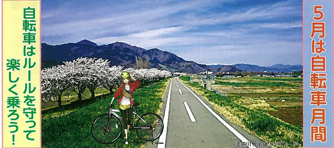
千曲川サイクリングロード