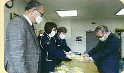
市内の新入学児童に贈呈するため女性部が作成した交通マスコット「かりんちゃん」を、市教育長に直接手渡した。(諏訪)