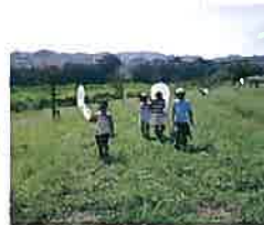
20年前の講座の一枚

正面の小川で遊ぶ親子の姿が多くなりました 野外自然観察ブームが来るかも!? https://www.kawaranbe.net/