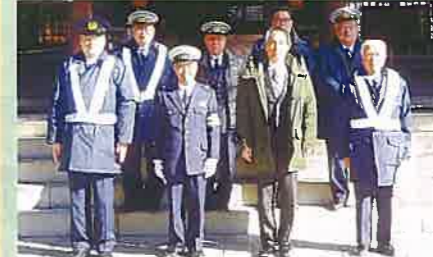
今年一年の交通安全を願い、諏訪大社下社秋宮において安全祈願祭を行った。(岡谷)