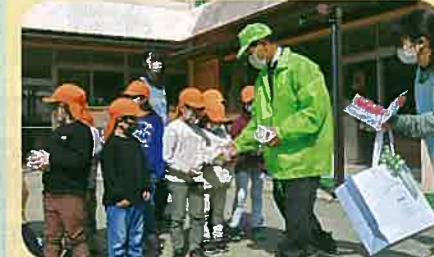
今春から新一年生になる管内の園児に「交通安全すごろく」を贈呈した。(松本)