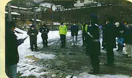
交通死亡事故発生に伴い、警察、各行政機関等と再発防止のための現地診断が行われた。(塩尻)