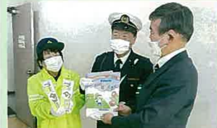
4月から小学校に入学する児童に贈る反射材や交通安全の文房具等を直接教育長に手渡した。(辰野)