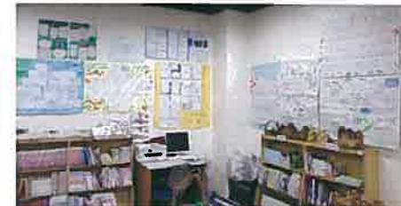
最近のメッセージはここに展示しています

毎年、小中学校・高校や保育園・幼稚園など、多くの方々にリクエスト講座を利用いただいています。ときには学習後に感想・手紙・絵画などにして心温まるメッセージをお届けいただくこともあります。これらの最新のものは1階サイエンスラボ奥の児童図書コーナーの壁に貼らせていただいているのですが、これまでにいただいたお手紙は左の写真のように保管しています。その数は段ボール箱で3-4箱にもなります。たまに読み返して、その時のことを思い出し、明日の学習運営への励みにしています。