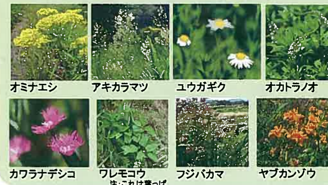
オミナエシ アキカラマツ ユウガギク オカトラノオ カワラナデシコ ワレモコウ フジバカマ ヤブカンゾウ 注:これは葉っぱ