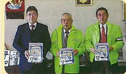
管内の新入学児童全員に交通安全冊子、事故防止グッズ等を贈呈するため各小学校に手渡した。(南佐久)