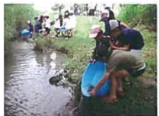
「大きく育ててね」「また来るね」生きものが元気に戻っていく姿を見ながら声をかけると 気分も晴れやか