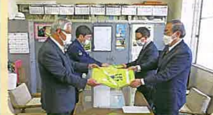
新入学児童のランドセルカバーと集団登校用班長旗を管内の市町村教育委員会に贈呈した。(須高)