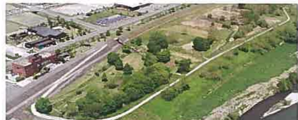
【注】新型コロナウイルス感染症の拡大が懸念される場合、天竜川河川敷(水辺の楽校も含む)の利用が規制される場合があります