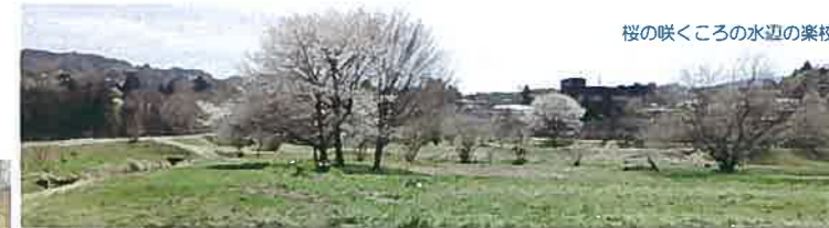
桜の咲くころの水辺の楽校