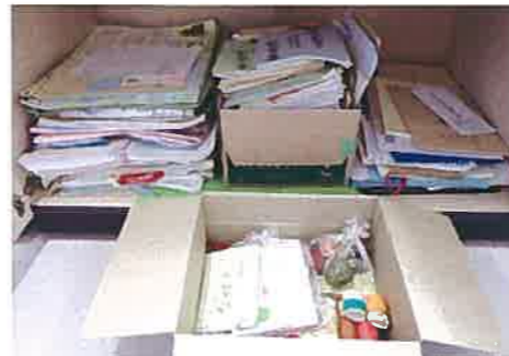
これまでに頂戴したメッセージの数々

毎年、小中学校・高校や保育園・幼稚園など、多くの方々にリクエスト講座を利用いただいています。ときには学習後に感想・手紙・絵画などにして心温まるメッセージをお届けいただくこともあります。これらの最新のものは1階サイエンスラボ奥の児童図書コーナーの壁に貼らせていただいているのですが、これまでにいただいたお手紙は左の写真のように保管しています。その数は段ボール箱で3-4箱にもなります。たまに読み返して、その時のことを思い出し、明日の学習運営への励みにしています。