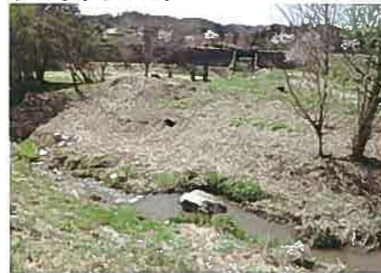
2022年4月作業後 明るくて広々した景観になりました