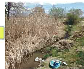
2021年4月作業前 オガが茂って壁のようでした