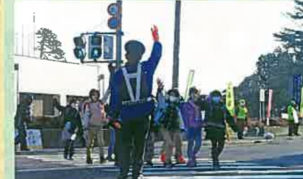
登校中の小学生に横断歩道の渡り方を指導すると共に通行車両に安全運転を呼び掛けた。(安曇野)