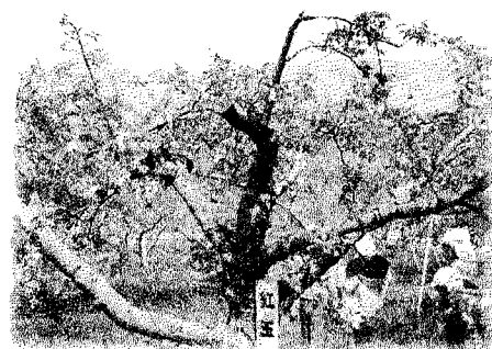
【2年生りんご園散歩】