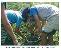
20年前の講座の様子