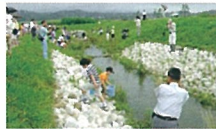
20年前の水辺の楽校開園の様子