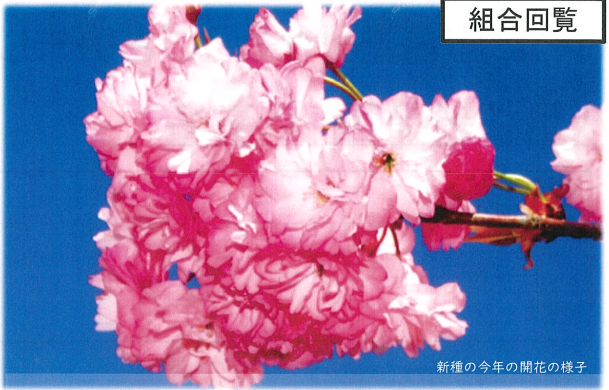
新種の今年の開花の様子