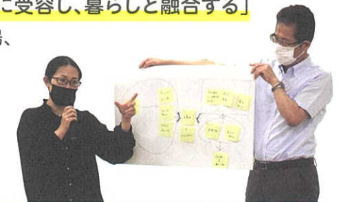
ワークショップで出されたキーワード(アンケート含む)

6月10日開催の第1回ワークショップでは、「飯田の文化とは何か」をテーマに3班に分かれて意見交換と発表をしました。ワークショップでは、「人との関係をつくる」「地域の人たちが学ぶ場所」「市民とプロと行政のコラボレーション」「地域の人たちが集まって創り出すところ」「文化を主体的に受容し、暮らしと融合する」などの意見が出され、文化会館の機能や場、概念に関するキーワードがみえてきました。