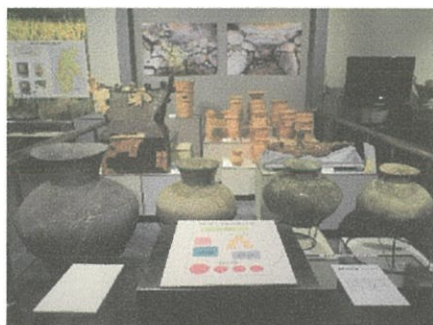
考古博物館常設展示（一部）