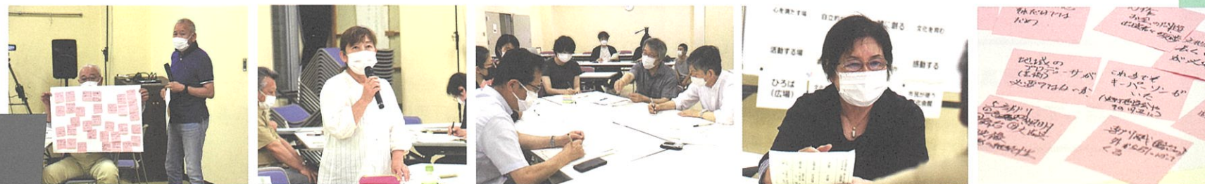
7月19日の検討委員会・ワークショップの様子