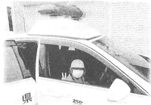
「警察官の気分です」 【3年飯田社会見学 警察署他へ】