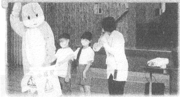
「右見て、左見て、もう一度右見て」 【秋の交通安全教室 アジマ自動車学校の方に指導をしていただきました】