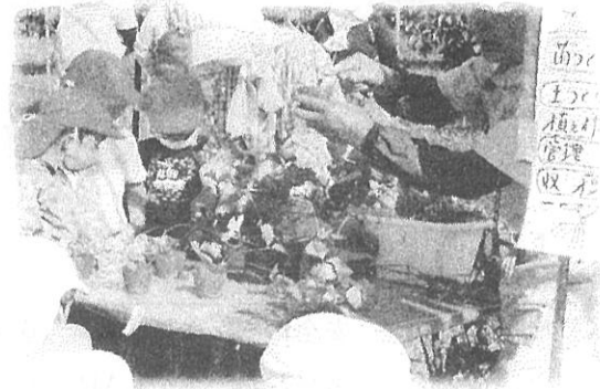
「あまーいイチゴが育つといいな」 【今田平イチゴ定植作業 1・4年】 収穫は来年2月頃からです