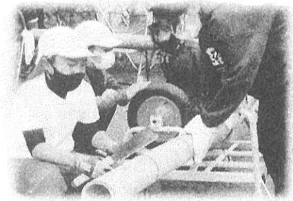
【5年生竹ランタン作り】