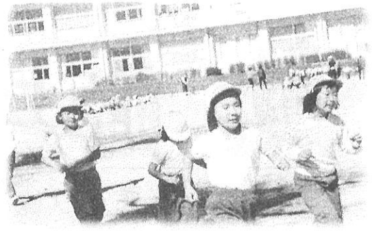
「マラソン大会全力でがんばりました！」 【皆様の応援が力になりました】