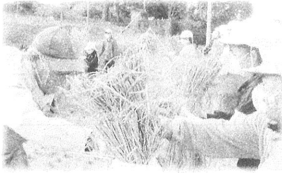
「はざがけしてあった稲を脱穀しました」 【地域の方の支援・協力を感謝です】