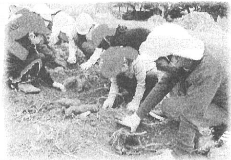
【1・6年生で仲よくおいも掘り】

10月に入り学級園ではおいも掘り、5年の田んぼでは稲刈り・脱穀、学校りんご園ではシナノスイートの収穫を行い、実りの秋を実感しています。また、10月14日には、教育課程研究協議会の人権教育の授業を5年生が公開し、本校の教科研究についても成果を発表するよい機会となりました。11月に入り、いよいよ150周年記念式典となります。子どもたちの発表を楽しみにしていきましょう。