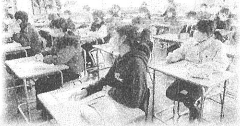
「緊張したー!」「勉強難しい!」 【6年生 ときどきの中学体験入学】