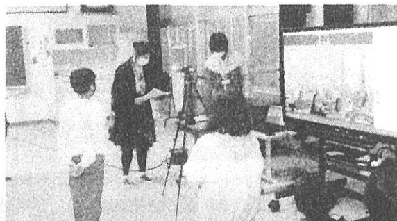
「ボンジュール!」 【4年生フランスオンライン交流】