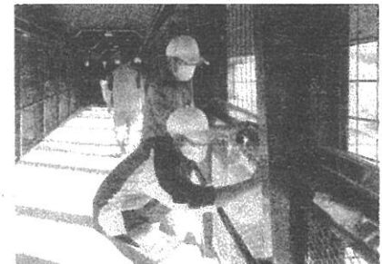
そらさんぼの清掃活動