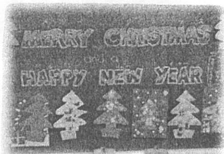
【1年生のクリスマスツリー】