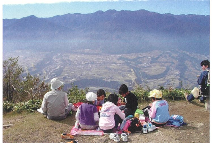
手前が天竜川・左が田切川・右が中田川で、正面の台地に【田切】の様子が見えています

最近のキャンプブームで併設のキャンプ場には来訪者が多く、その筋では一躍人気のスポットのようですが、冬季はアクセス道が閉鎖され車の通行はできませんのでご注意ください。(冬季通行止め期間12/2~3/31:詳細情報は中川村ホームページ参照)