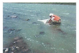
辰野町新樋橋 2000年8月湖沼性プランクトンが豊富に流れていたころ

ヒゲナガが上伊那地域の北部で多い理由を【冊子】では諏訪湖の存在に関連づけ、①水門で制御され安定した流量 ②諏訪湖から流れ出る豊富なプランクトン(ヒゲナガのエサです) ③周辺にたくさんの土砂を出す流入河川が少ないこととしています。特にヒゲナガのエサとなる湖沼性プランクトンについては、『諏訪湖再生ビジョン』によると植物プランクトンの「アオコ」は2000年頃に激減し、プランクトンの減少とともに湖水の透明度も上昇したようです。これをもたらしなのが水質浄化。水質改善がエサを減らし、間接的にヒゲナガの生息量を落着かせたようです。なったのかもしれない。