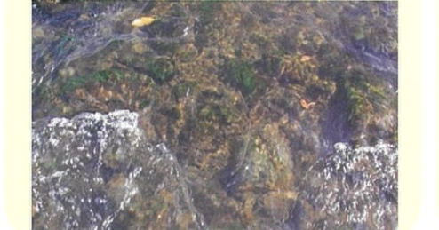
辰野町新樋橋 2001年11月27日撮影