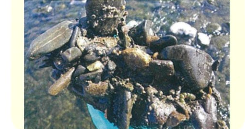
箕輪町北島 2011年1月28日撮影

幼虫は川の小さなゴミ（微粒子有機物）を一日中食べ続け、半分は糞（うんち）として川底に放出します。幼虫の食欲旺盛な季節には直径2mm弱ほどの糞の粒が流れの弱い場所にたまりやすくなります。写真は幼虫の数が多かった頃の川岸の様子で、泥だまりのように見える茶色のかたまりが無数の糞です。これが糞と気づいた時は衝撃でした。