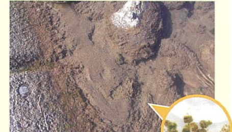
辰野町新樋橋 2002年2月14日撮影