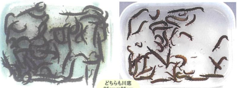
辰野町新樋橋 2000年12月調査:天竜川上流河川事務所※ 辰野町新樋橋 2023年1月調査:かわらんべ ※『平成12年度天竜川上流水生動物の浄化機構調査』(天竜川上流河川事務所, 2001年) 【注】ザザムシは3年に1度くらい多い年があり、比較した両年は その多い年にあたる ともに数回採集した中で多いサンプルを選出

ザザムシ漁のこの時期、以前より「ざざ虫」が減ったというニュースをよく目にします。確かに、幼虫の多い冬季と比べてみると、約20年前より少ないことは明らかです。天竜川の河川文化の象徴が減ってしまったことにマイナスのイメージで受け止められることが多く、中には「環境が悪くなったんじゃない?」と疑う声も聞こえてきますが、各地の川の川虫を見た経験から、以前の尋常でない生息量の方が普通ではなく、最近の方が通常に近いものと感じます。そのことを示すのは、同時に他の種類が増加して群集全体が多様化に向かっていること。「落ち着いた」ことは、長い目で見て、良い方向に進んでいると考えてよさそうです。