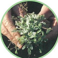
以前あったゴギョウ(2010年)