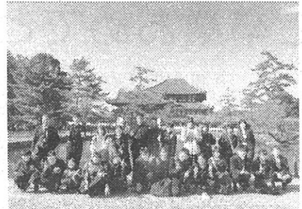
1日目 東大寺にて A組

コロナ禍の修学旅行でしたが、実現に向けご理解・ご協力をいただいた保護者の皆さまをはじめ支えていただいた全ての方々に感謝いたします。