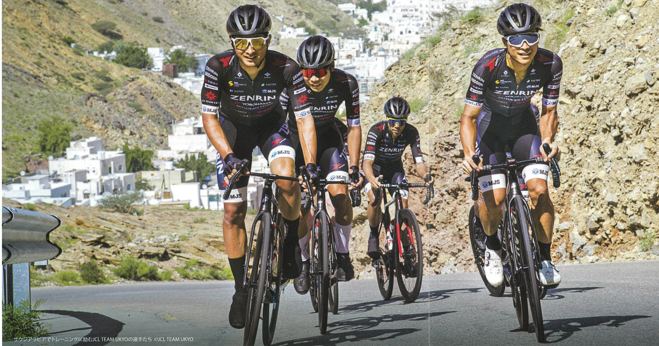
サウジアラビアでトレーニングに励むJCL TEAM UKYOの選手たち

「JCL TEAM UKYO」(旧「チーム右京」)が1年ぶりに飯田へ帰ってきます。コロナ禍とともにあった「自粛モード」が解け、ついに「声出し」をとまなう応援・観戦が解禁された2023年春。国際的な自転車ロードレース競技であるツアー・オブ・ジャパン(TOJ)第5戦「信州飯田ステージ」は、今年もホームチームであるJCL TEAM UKYOなど16チームがエントリーして飯田市下久堅の周回コースで開催されます。昨年はホームを初制覇した勢いそのままにTOJ総合優勝も達成。私たち飯田の仲間も熱い声援を送りながら全力応援でサポートします。頑張れ、JCL TEAM UKYO!