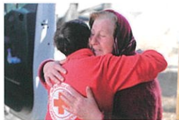
厳しい状況に苦しむ女性を元気づけるウクライナ赤十字ボランティア