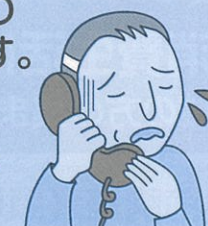
(消費者庁イラスト集より)

被害者は、高齢者に多く、自宅の固定電話に犯人からの電話がかかってきたことをきっかけに被害にあっています。