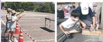
※昨年の活動の様子