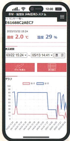
スマホ画面イメージ