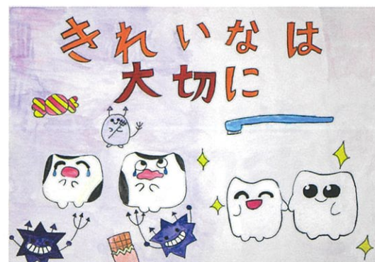
2022 歯と口の健康づくり ポスターコンクール入賞作品