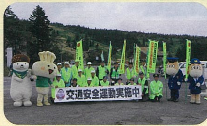
「秋の全国交通安全運動」に伴い、管内の国道において群馬県西吾妻交通安全協会と合同で街頭啓発を実施した。(中高)