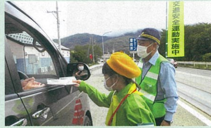
「秋の全国交通安全運動」の活動の一環として、管内の国道で交通少年団による街頭啓発を実施した。(大町)