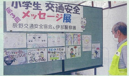
管内の小学生から出展があった交通安全メッセージの審査会を実施した。(辰野)