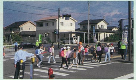
「秋の全国交通安全運動」の活動の一環として、通学路の横断歩道において、小学生に対しルールマナーアップ啓発を実施した。(須高)