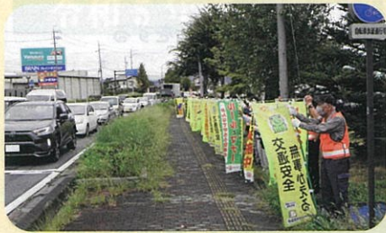
「秋の全国交通安全運動」の活動の一環として、県道長野真田線において街頭指導を実施した。(長野南・松代)