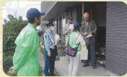
「秋の全国交通安全運動」の活動の一環として、高齢者宅を訪問し交通事故防止を呼び掛けた。(小諸)