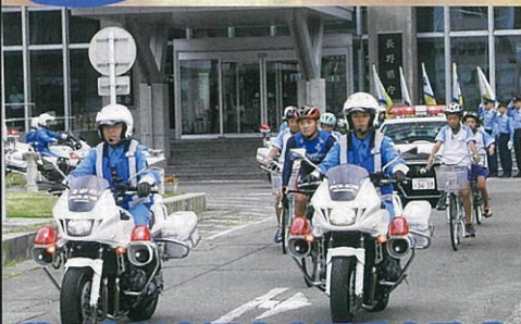
秋の全国交通安全運動出発式