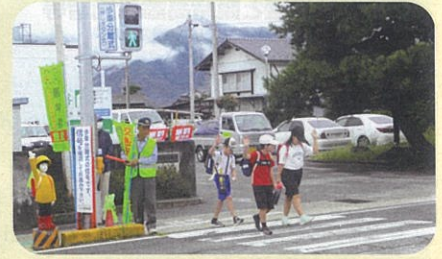
「秋の全国交通安全運動」の活動の一環として、管内の通学路で通学児童への見守り活動を実施した。(池田松川)