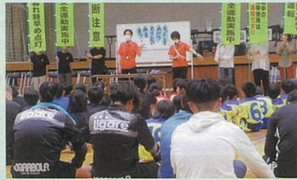
交通安全ジュニアスポーツ大会を開催し、参加者に交通安全教育を実施した。(千曲)