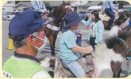
「秋の全国交通安全運動」の活動の一環として、管内の道の駅周辺で「騎馬隊」による街頭啓発活動を実施した。(安曇野)