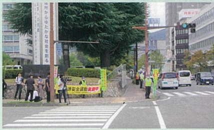
「秋の全国交通安全運動出発式」に併せて県庁前交差点において街頭啓発を実施した。(長野)

交通安全協会は、交通事故をなくすため、様々な活動を行っています。活動の一例を紹介します。