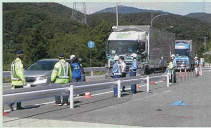
「秋の全国交通安全運動」に伴い、管内の国道152号において諏訪交通安全協会と合同で街頭啓発を実施した。(依田窪・諏訪)