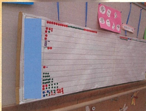
今年も「歩こう歩こう」