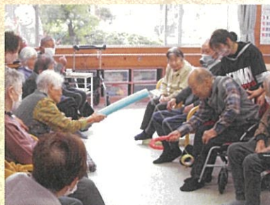
楽しくレクリエーション