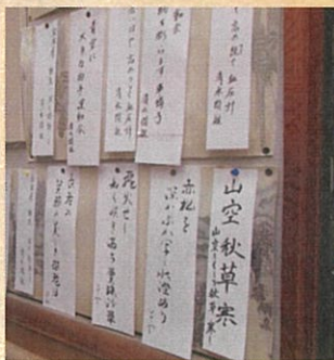
晩秋を詠んでみました。