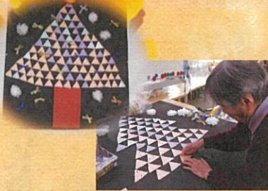
ツリーの壁飾り作り…根気がいります