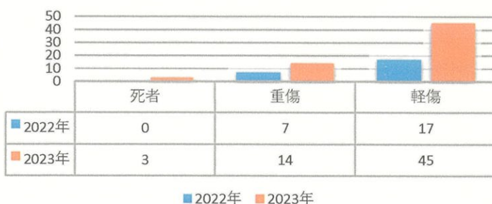
飯田警察署管内 歩行者事故による死傷者数

歩行者事故による死傷者数も2022年に比べ、2023年は著しい増加傾向が見て取れます。