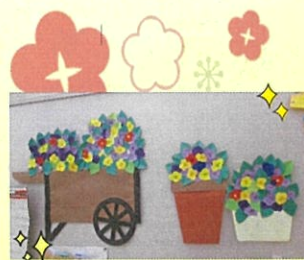
色とりどりのパンジー