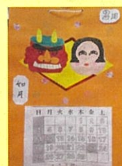
今月のカレンダーは節分♪