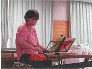
琴 & 大正琴

令和6年2月発行 発行元 かわじデイサービスセンター ☎ 0265-27-5022