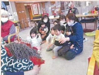
おむすび保育園の子どもたちも見に来てくれました。