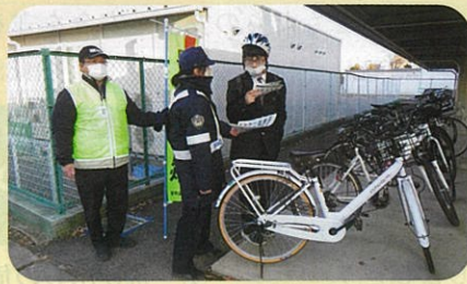
「年末の交通安全運動」の活動で、管内の高校において自転車ヘルメットの着用啓発を実施した。(須高)