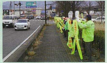
「年末の交通安全運動」の活動で、松代大橋前県道において街頭啓発活動を実施した。(長野南・松代)