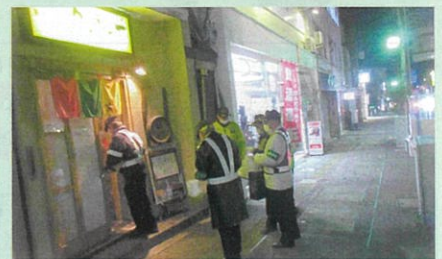
「年末の交通安全運動」で、飲食店を対象とした「飲酒運転防止パトロール」を実施した。(飯伊)