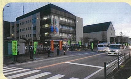
「年末の交通安全運動」で、諏訪警察署前において街頭啓発活動を実施した。(諏訪)