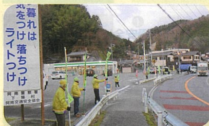
「年末の交通安全運動」で、管内の国道において街頭啓発活動を実施した。(阿南)