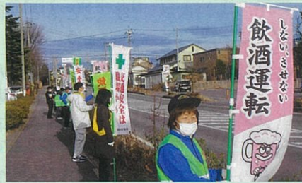
「年末の交通安全運動」で、御代田町内の県道において飲酒運転防止などを呼び掛けた。(佐久)