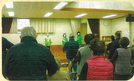
管内の公民館において高齢者に対する交通安全教室を開催した。(小諸)