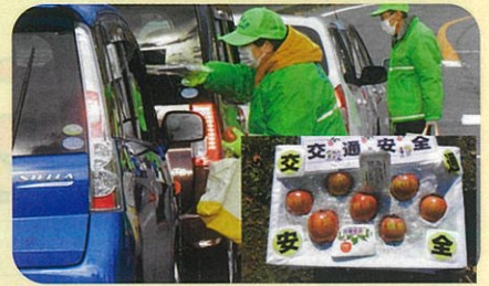
「年末の交通安全運動」で、ドライバーに「交通安全文字入りりんご」を手渡しして交通事故防止を指導した。(川西)