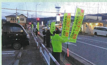
「年末の交通安全運動」で、市役所西県道交差点において街頭啓発活動を実施した。(茅野)