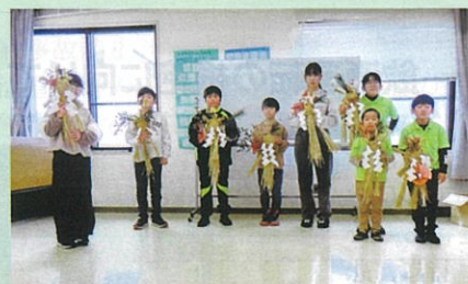
「年末の交通安全運動」で、少年部による交通安全を祈願した「正月飾り作成研修会」を開催した。(安曇野)