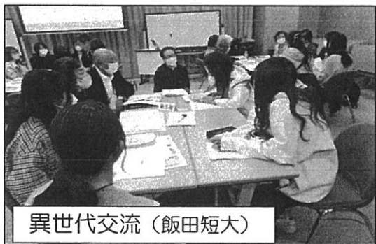
異世代交流(飯田短大)