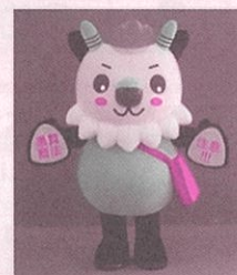
長野県消費者被害防止啓発キャラクター もシカっち