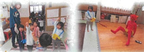
オニ退治だ「エイエイオー」