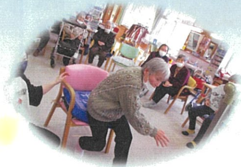
ナイス!!コントロール