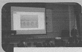
いろいろな先生に教わる機会が増えました。全校道徳、人権講演会、情報モラル講演会、親子学習会、学校保健委員会