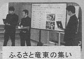
ふるさと竜東の集い