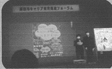
1年ふるさと学習の発表 飯田市キャリア教育フォーラム