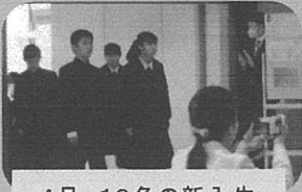
4月、19名の新入生を迎えました