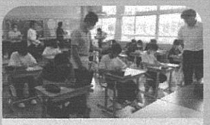
教育課程研究協議会 総合的な学習の時間