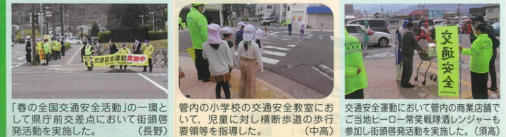
「春の全国交通安全活動」の一環として県庁前交差点において街頭啓発活動を実施した。(長野) 管内の小学校の交通安全教室において、児童に対し横断歩道の歩行要領等を指導した。(中高) 交通安全運動において管内の商業店舗でご当地ヒーロー常葉隊降参ランジェーも参加し街頭啓発活動を実施した。(須高)

交通安全協会は、交通事故をなくすため、様々な活動を行っています。活動の一例を紹介します。