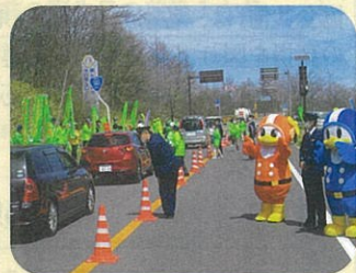
「春の全国交通安全運動」において国道141号県境で長野、山梨合同による街頭啓発活動を実施した。(南佐久)