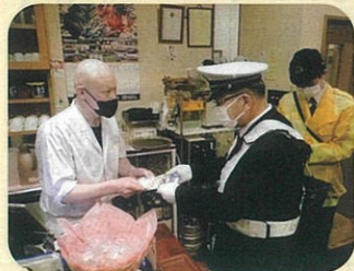
「春の全国交通安全運動」の一環として上諏訪駅周辺の飲食店に対し飲酒パトロールを実施した。(諏訪)