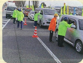
「春の全国交通安全運動」の一環として国道153号伊南バイパスにおいて交通指導所・人波作戦を実施した。(伊南)