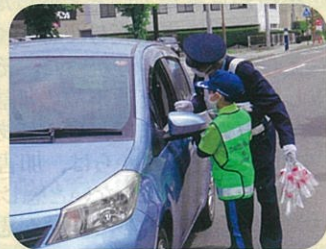
「母の日」に警察署前で少年部員が運転手にカーネーションを配付し安全運転を呼びかけた。(安曇野)