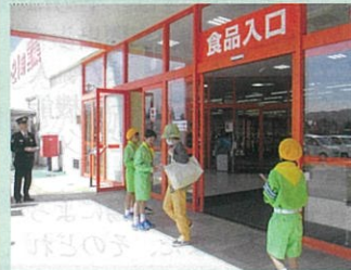
「春の全国交通安全運動」の一環として管内の商業施設で交通少年団による街頭啓発活動を実施した。(大町地区)