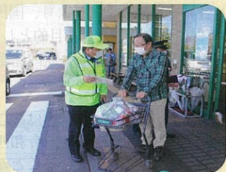
「春の全国交通安全運動」の一環として管内のショッピングセンターにおいて街頭啓発活動を実施した。(依田窪)