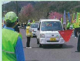
「春の全国交通安全運動」において国道19号県境で長野、岐阜合同による街頭啓発活動を実施した。(木曾)