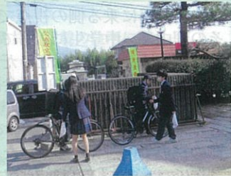
「春の交通安全運動」の一環として管内の高校において自転車のヘルメット着用等の啓発活動を実施した。(飯伊)