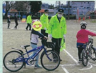
「春の全国交通安全運動」の一環として管内の小学校において交通安全教室を開催した。(辰野)