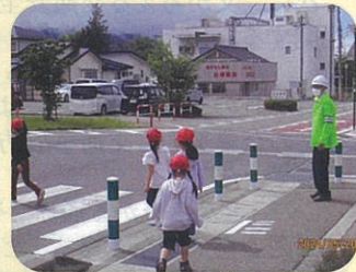
管内の小学校の交通安全教室において児童に対し横断歩道の歩行要領等を指導した。(池田松川)