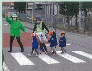
管内の保育園において園児に対する交通安全教室を開催した。(川西)