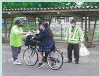
「自転車安全月間」の活動の一環として管内の高校においてヘルメット着用の街頭指導を実施した。(長野南)

交通安全協会は、交通事故をなくすため、様々な活動を行っています。活動の一例を紹介します。