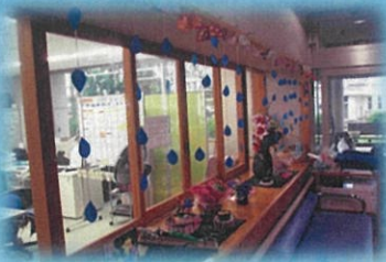
いつも頂いたお花で玄関がにぎやか です。ありがとうございました。