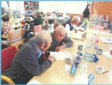
難しい問題も、仲間と相談すれば、 よし！わかった！