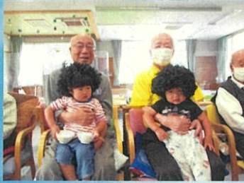
おむすびの園児が変装して登場