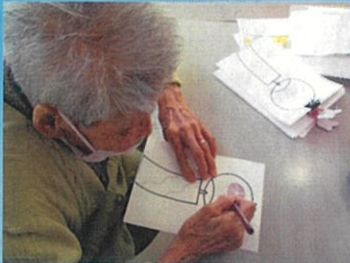
一人一枚オリジナルの風鈴作り、 来月の廊下を飾ります。