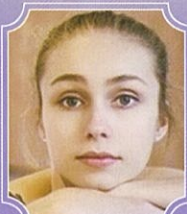
マリア・ヴォロホビナ