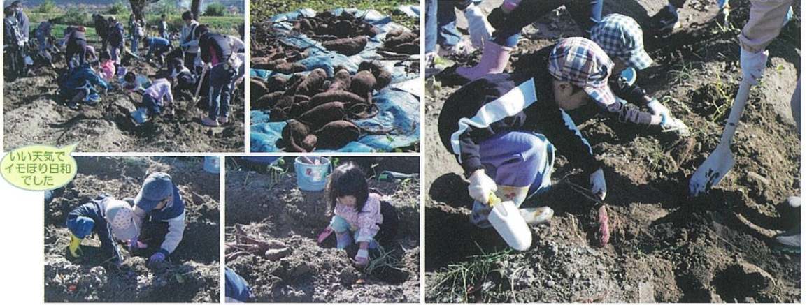
いい天気でイモほり日和でした

防災講座などにご参加いただいたみなさんを招待しての特別講座 サツマイモを収穫して、そのイモで焼き芋づくり 自分で焼いたイモの味は格別でした