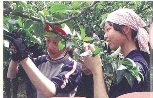
飯田東中・追手町・浜井場・丸山小学校 「りんご並木」

飯田のシンボルである「りんご並木」。中学生が中心となり、小学生と摘果し、高校生と花を植え、地域の方と作業する取組。