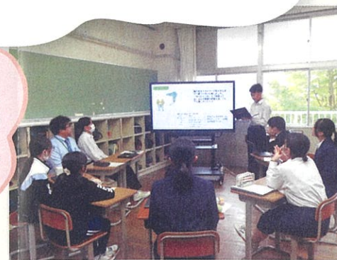
飯田西中・丸山小学校 「かざこし学習発表会」

飯田西中生と丸山小6年生が合同で、一年間の地域学習の成果を発表し合い、意見交換する機会。