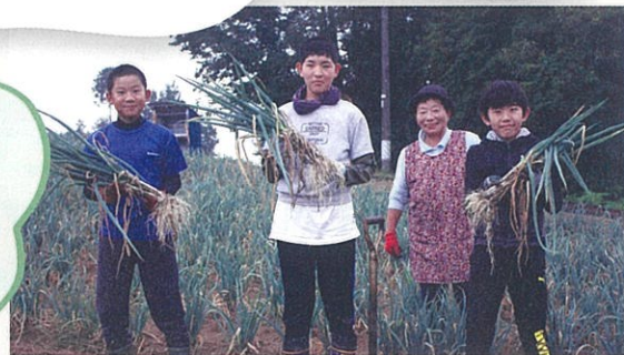
千代・千栄・上久堅小学校「ふるさと子ども夢学校」

3校合同で他校の友達と地元農家の民泊を体験。農家の方の農業と地域に対する思いを知る機会。