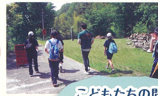
竜東中学校 「地域探究型総合学習～ふるさと再発見の旅～」

飯田のシンボルである「りんご並木」。中学生が中心となり、小学生と摘果し、高校生と花を植え、地域の方と作業する取組。