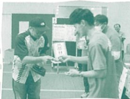
信州ブリリアントアリーズ