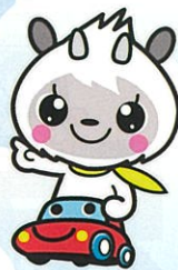
長野県交通安全協会マスコット 「あんぎょくん」